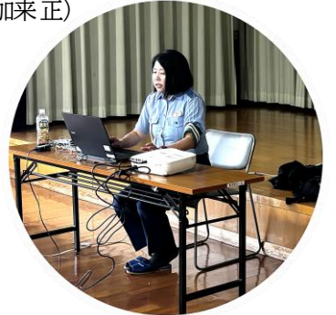
小倉南署署員による講話