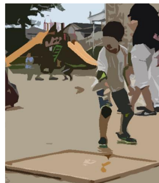
コマ回し、回ったかな?