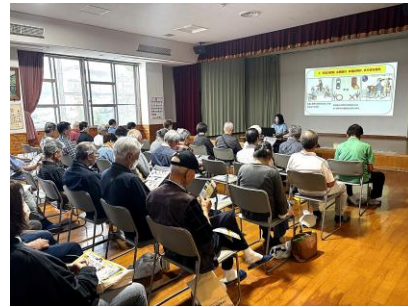
スクリーンを使っての説明

次に、交通反則通告制度が導入された自転車の安全運転利用五則について講話がありました。①車道が原則、左側通行②交差点では信号と一時停止を守って安全確認③夜間はライトを点灯④飲酒運転は禁止⑤ヘルメットを着用。16歳以上の自転車運転者による一定の交通違反に対して、交通反則通告制度(いわゆる青切符)の違反処理が行なわれます。(校区老連加来正)