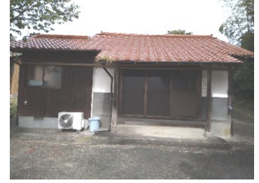
22番札所日尾の薬師堂