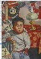
青柳喜兵衛(山岡コレクション) 山岡白鳥美術館蔵

【コレクション展Ⅰ】 特集 青柳喜兵衛 玉葱の画家の軌跡 5月16日(土)～8月16日(日)