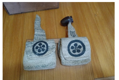
九右衛門さんの遺品の煙草入れです