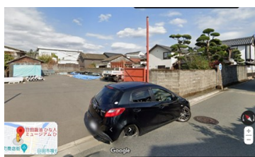
日田豆田牢跡です 現在資材置き場になっています