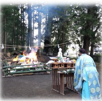
中谷地区どんど焼きの様子 (西大野八幡神社)