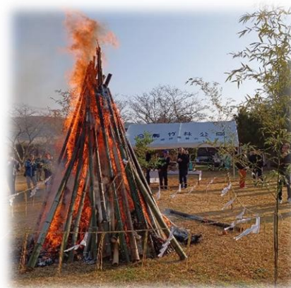
合馬校区どんど焼きの様子 (合馬公園)