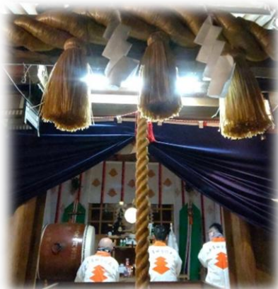
西大野八幡神社年越祭