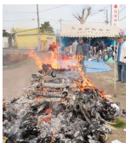
宗像神社のお焚き上げ

当日は、10時から宮司の祝詞奏上の後、氏子の代表が玉串を奉納して正月飾りやお札をお焚き上げしました。福餅の販売には、餅一つ200円で空くじなしの豪華賞品が準備されており、抽選券付の福餅を購入のため長い列ができていました。特別一等賞は、大人も片手で持てない重さのカーボンヒーターでしたが、小さな子どもが引き当てました。くじ引きで買った福餅を竹の先にさしてお焚き上げの炎で焼いて食べていました。この一年の「無病息災」をお祈りいたします。幸い好天に恵まれ参拝者は、約300名と賑やかに盛り上がりしました。 （まち協広報部会）