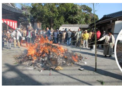
福餅を竹竿に刺して炎に...