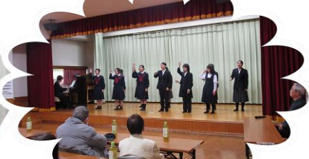
曾根中：音楽部の生徒さん♪