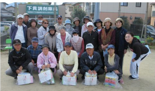
競技終了後、賞品を手に入れた全員で記念撮影

11月6日(木)貫児童公園に於いて、城田シニアGGクラブ対藤田町若藤会の第3回グラウンドゴルフ交流戦を行いました。絶好の秋晴の下、24名が班に分かれて、3ラウンドの熱戦を繰り広げました。昼食の懇談が終わって、成績発表では優勝から5位までとホールインワン賞、BB賞、参加賞を受け取り、記念写真を撮って終了しました。(まち協広報部)