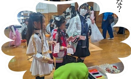
かわいいキャラクターに仮装して...