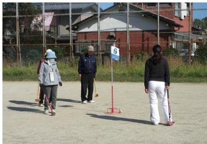
ホールインワンを目指して楽しむ参加者