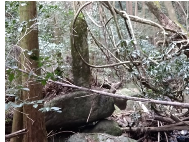
小笠原忠真公歌碑です。歌碑の手前に架かる石橋がありますが修験僧が作ったと伝わります。