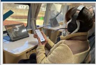
実際にセミナーを受けているお客様