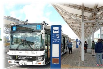
車両には、死角がないようにたくさんのカメラが設置されていました

12/12(木)~18(水)、北九州市と西日本鉄道による自動運転バスの実証運行(約10.5km)が行われました。導入することにより、運転士不足解消・バス路線の維持と体力的な負担の少ないシニアの方が活躍できる場を創出できるとのことです。参加された皆さんの、アンケートでの声が本格運行に繋がることでしょうか!ありがとうございました。