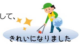
きれいになりました

12月6日(金)地域のボランティアの方々が参加して、朽網駅周辺の清掃作業が行われました。皆さま、寒い中ありがとうございました。【参加者 47名(スターフライヤー5名)】