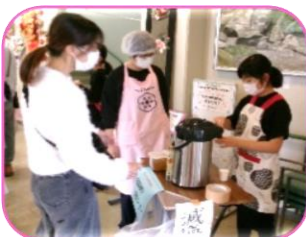
↑減塩みそ汁の試飲