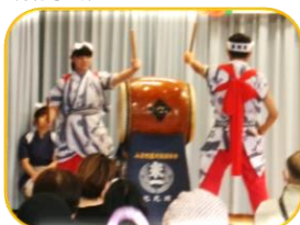
↑初参加の 小倉祇園太鼓！