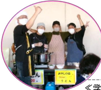
↓おやじの会のうどん