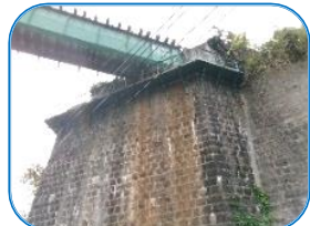
香春駅と採銅所駅との間にある六十尺橋梁(高さ約18m)