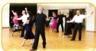
素敵な音楽とダンスに魅了され、優雅なひとときを過ごしました…