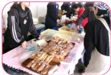
↑「あっ！」という間に売り切れてしまったパン。

食、手芸品、余剰品、喫茶店など多くの種類のバザーが出店し、どのお店も大盛況でした！今年も「北九州市立大学」6名、「ポリテクカレッジ」8名、「常盤高等学校」5名、とたくさんの学生ボランティアさんが参加してくれました。ステージ部門の司会やバザーやカフェのスタッフ、志井小学校で同日開催された「わくわくカーニバル」のサポートなど大活躍でした！