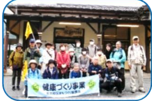
築100年を超え大正時代の雰囲気が残っている採銅所駅前。参加者全員で記念撮影。