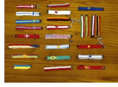
ワークショップで作れる携帯ストラップのサンプル