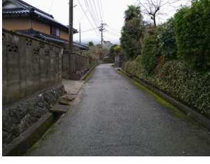
木下門村の旧秋月街道