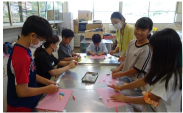
8/20 谷っ子クラブ 「アロマキャンドル&消しゴム作り」