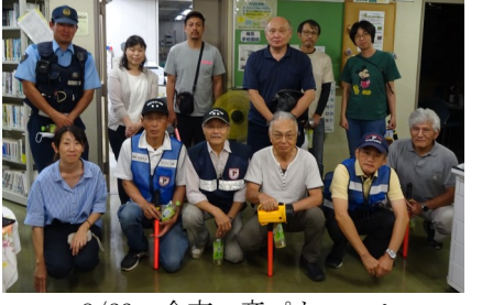
8/23 全市一斉パトロール