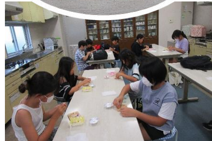
どのようなデザインにしようかな~