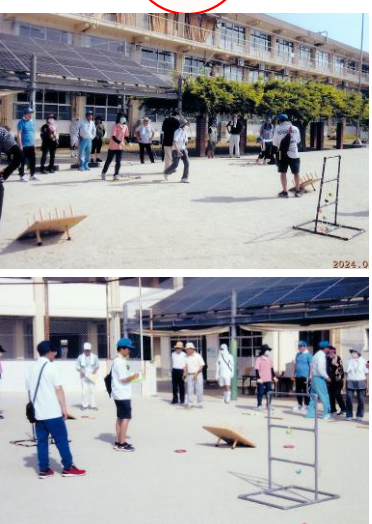
輪投げ・ラダーゲッターは投げるたびに大盛り上がり♪

~でも笑顔が絶えない~ 7月21日(日)、上曾根町内会のモルック大会が曾根小学校のグラウンドにおいて開催されました。 潮田町内会長はじめ役員の方々が準備を整えて「さあ、開始だ」と思ったところ突然雨が降り出し、しばらく様子を見てみると天の神様が味方したのか?にわか雨で、すぐに試合が開始されました。 大人・子ども合わせて41名が参加されました。大人3パート、子ども1パートに分かれての熱戦は、最初は中々上手くないが「あっちゃ・と」か「なし」か「と」の声も聞かれましたが、猛暑のなか体調不良の訴えもなく、皆さん笑顔で最後まで頑張りました。(まち協広報部)