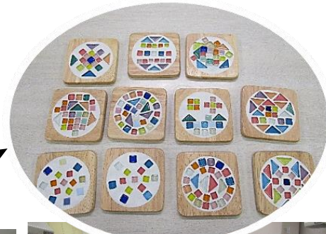
手作りの素敵なオリジナルのコースター

今回の工作では、「タイルコースターのミニかごバッグ」を作りました。一人一人好きな色のテープを選んでもらい、一本一本編んでいきました。途中難しいところもありましたが、みんな最後は可愛いかごバッグを完成させることができました。自主学習だけでなく工作も取り入れ、楽しい時間を過ごすことができました。