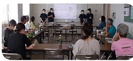
【7月18日定例会で健康発表】