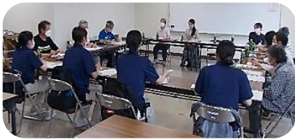
【6月26日定例会の様子】

横代校区健康づくり委員会の6月、7月定例会に西南女学院大学看護学科の4名の皆さんが実習で参加されました。7月18日の定例会では健康づくり委員会の皆さんに向けて「熱中症対策」について健康教育を行いました。熱中症予防に効果的な水分補給のタイミング等の話しをわかりやすく発表されました。