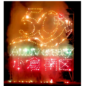
小倉南区制50周年記念花火