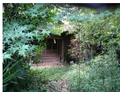
目倉の刀工鍛造場跡

それと6月に婦人会の皆さんの研修として行った小倉織の体験会(ミニストラップ作り)を一般の方向けに間もなくご案内できますので、興味のある方はぜひご参加ください。詳細は準備ができ次第「東谷まちづくり」の誌面(郷土資料館便り)でお知らせします。