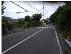
目倉の旧322号線から左に分かれる道が旧街道