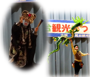
変面&風船アートショー