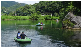
8/3 ガンシャモク観覧会