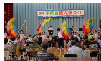
サマーコンサート