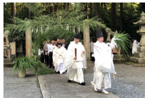
7/21 東大野八幡神社 夏越祭