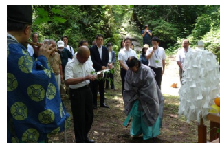
登山者安全祈願祭