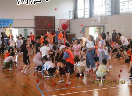
ゲームに挑戦！元気いっぱいの児童