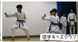
空手キッズクラブ