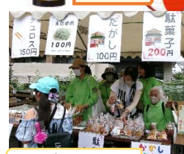
庭づくり委員会 チュロス・枝豆・駄菓子