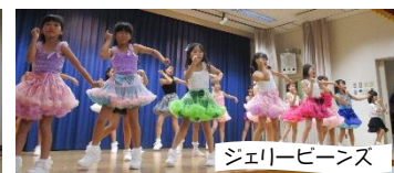
ジェリービーンズ