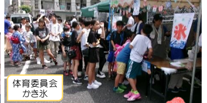
体育委員会 かき氷