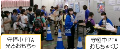
守恒小PTA 光るおもちゃ