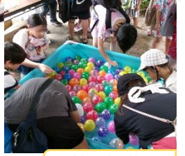
子ども会育成協議会 ヨーヨー・輪投げ