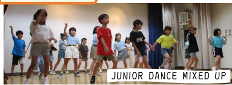
JUNIOR DANCE MIXED UP