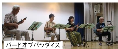
ハードオブパラダイス