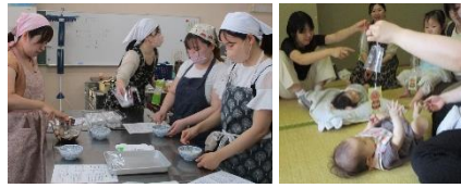
今日の館長からの お土産は アンパンマン風鈴