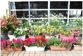
5月の森津根ガーデン