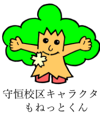
守恒校区キャラクター もねっとくん