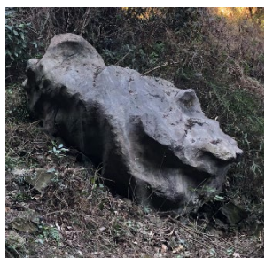
「白亀岩」と名付けられた、石灰岩の巨石。谷底にあり、周囲にはおびただしい量の岩塊(角張った岩石)が群がります。この「白亀岩」が現地性のものなのか、山頂付近から落下したものなのか・・・、はっきりしたことは分かっていません。