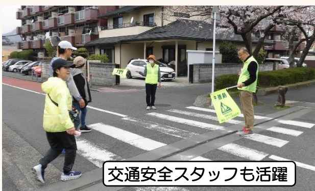
交通安全スタッフも活躍