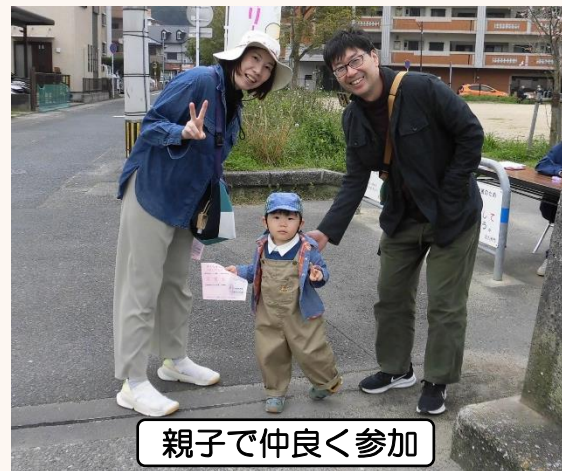
親子で仲良く参加