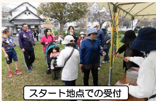
スタート地点での受付