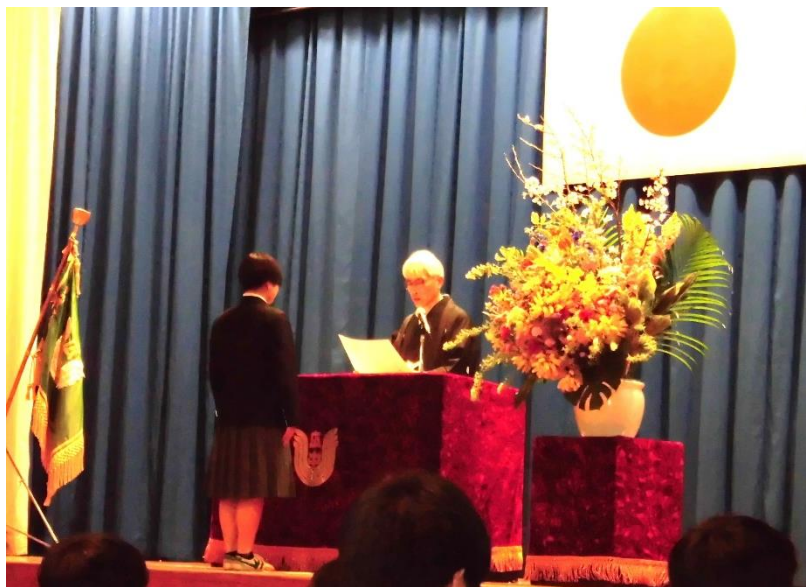
↑ 広徳中学校卒業式

広徳中学校並びに徳力小学校の卒業生の皆さん、ご卒業おめでとうございます。 広徳中学校の卒業式は、3月8日に行われ150名の生徒が卒業されました。 また、徳力小学校の卒業式は3月18日に行われ、78名の児童が卒業されました。 コロナ禍で交流は十分にできませんでした。皆さんは徳力校区の宝です。 これからも、これまでと変わらず、地域で見守っていきたいと思います。 たくさんの思い出をありがとうございました。