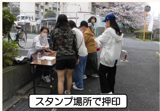
スタンプ場所で押印