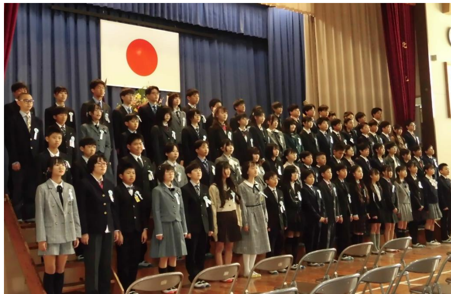
↑ 徳力小学校卒業式