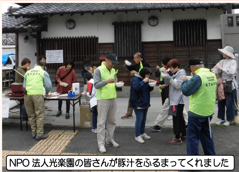
NPO 法人光楽園の皆さんが豚汁をふるまってくれました

参加者は、紫川河畔公園をスタート。八旗橋、徳力けやき公園、小倉南武道場、徳力2丁目公園を巡り紫川河畔公園でゴール。5か所のスタンプを押してゴールした方には完歩賞を渡しました。