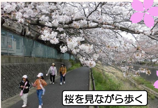
桜を見ながら歩く