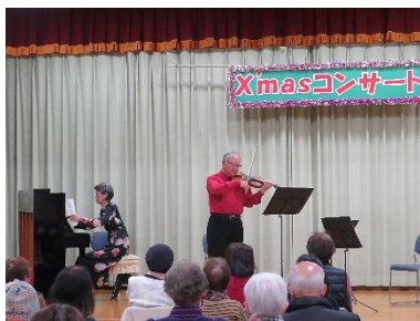
素敵な音色のヴァイオリンとピアノの生演奏♪