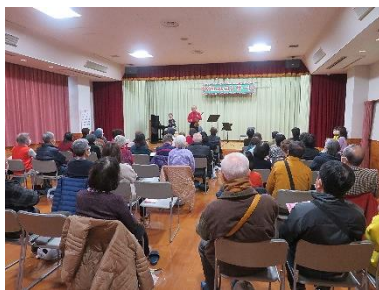
素敵な演奏やクリスマスソングと一緒に歌って大いに盛り上がりました♪