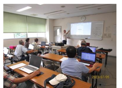
プロジェクターを使って、分かりやすく説明して学習します

小倉南区の市民センターだよりなど地域の情報をスマホやパソコンからいつでも見ることができます。右のQRコードを読み取ってください。 https://report.kaze-minami.com/