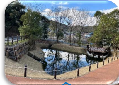
美しくよみがえった「志井うるおい池」

改修工事が終了し「志井うるおい池」は美しくよみがえりました。今年度の志井川さくらまつり2024は恒例の出店と、「志井うるおい池完成記念式典」を行います。みなさんのご来場おまちしております。