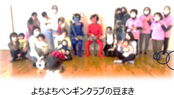
よちよちペンギンクラブの豆まき

☆次回子育て講座☆ 3/6(水) 10:30~12:00 そねっ子広場 3/27(水) 13:30~15:00 よちよちペンギンクラブ