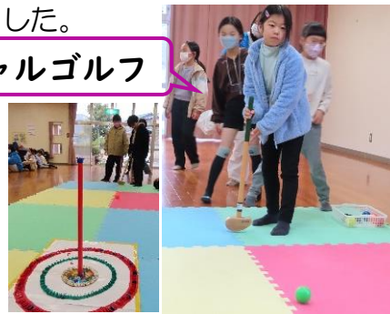
スペシャルゴルフ