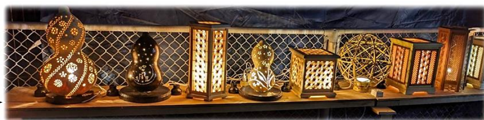
寿町子ども会 寿町町内会 寿町壮年部作品

63世帯136人の方が参加され、その他、他町内から15名もの見学があり、たいへん感激して帰られました。今年参加できなかった方も、次回は多数参加して頂ける事を願っています。たくさんのご協力ありがとうございました。(文責 壮年部 山口和夫)