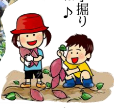
みんなで芋掘り 楽しいね♪