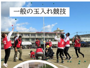
一般の玉入れ競技