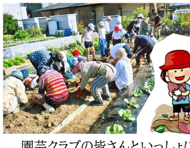
園芸クラブの皆さんといっしょに芋掘り♪