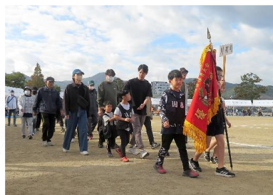
前回優勝の川部町内会を先頭に入場行進

曾根校区老人クラブ連合会「園芸クラブ」の収穫祭 収穫を迎えた喜びの芋掘り 毎年恒例となっている曾根小学校たんぼ組と、校区老連園芸クラブとのサツマイモ交流会を10月26日(木)に借用している梅田さんの畑で行いました。たんぼ組の生徒も園芸クラブの皆さんもこの日を楽しみにしていました。晴天に恵まれ、イモツルを切って生徒達が来るのを待ちました。午前9時に到着し、早速掘り始めました。今年は夏の猛暑の影響があったようで、大きなイモは少なく量もあまり多くありませんでしたが、イモがあるとあつちこつちで歓声が上がりました。みんな笑顔になっていました。園芸クラブの皆さんも多くの孫達に囲まれたよう楽しんでいました。芋掘り交流を通じて、収穫の喜びやふれあい等の体験を持つことができました。また、クラブ員の皆さんもたくさん元気を貰ったので、来年に向かって更なる活動意欲が湧いてきました。