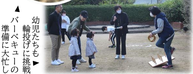
幼児たちも輪投げに挑戦 バーベキューの準備に大忙し