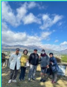
お食事処は絶景でした！

11/18(土)早朝参加者43名で出発しました。強風の中、日本の近代化の始まりで世界遺産である「八幡泊」を訪ねた後は、2016年の熊本地震復興のシンボルである「新阿蘇大橋展望所」へ。また、雄大な阿蘇を眺めながらその成り立ちを学びました。雪をかぶった美しい根子岳を見ながらの南阿蘇での昼食はとても美味しかったです。ところがその後、急に降った雪の影響などでトラブル続出。帰着時間を大幅に過ぎてしまいました。