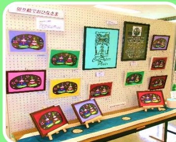
「切り絵でおひなさま」 初めてでも出来ました!

市民センター10クラブと、志井校区のみなさんに作品を展示していただきました。力作揃いに来館者からは感動の声があがっていました。