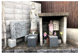
「寺ヶ迫の18人塚」(小倉南区沼)