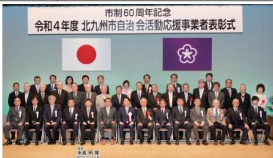
受賞事業者・推薦自治会のみなさん

施設の機材を提供し血圧測定、 骨密度測定など専門的視野で 地域の健康づくりに協力して いただいています。また、北九州 病院グループと一体となった行 事への参加、協賛金支援等で、 校区にとってなくてはならない 存在となっています。