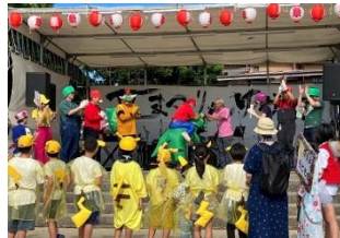
先生方、仮装おつかれさまです