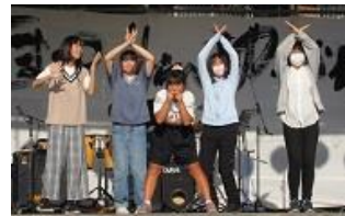
中学生の躍動感あふれる ダンス