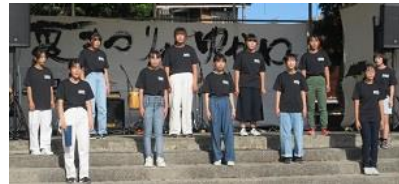
湯川中合唱部のすばらしい歌声