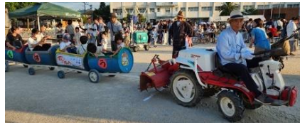
元気に発車トロッコ列車