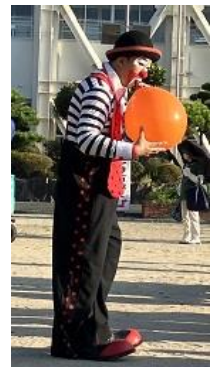
クラウンシロップさんの ショータイム