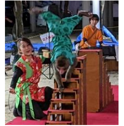
お猿さんの演技 に拍手！