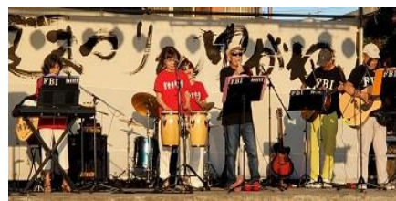
なつかしい曲のバンド演奏