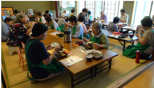
8/4 ふれあい昼食交流会の様子

「（員）ヘルスメイト・ボランティア」の活動に、皆さまの興味・関心を持っていただけると幸いです。微力でも草の根の様に、地域に根付き成長していければと思っています。