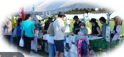
バザーテントの様子