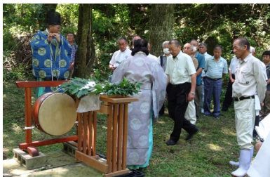
登山者安全祈願祭

7月29日（土）第72回平尾台観光まつりが開催されました。澄み渡る青空の下、小学生の開会宣言に始まり、セレモニーやコンサート、総踊りとさまざまなイベントを行うことが出来ました。今年は、地元のバザーやキッチンカーなどの出店もあり、活気をとり戻し賑わいました。また、東谷地区の多くの皆さまにご協賛いただき、盛大な花火もあがり、約5100人の方が来場し、楽しいひと時を過ごしていただけたのではないかと思います。皆さまありがとうございました。