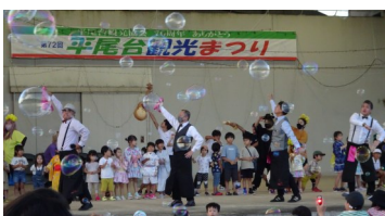
子どもたちも 飛び入り参加 の楽しいコン サート