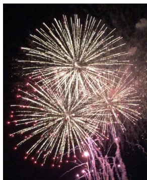
夏の夜空に咲く大輪の花火

振り返れば十余年前、現職で高齢者の方に関わる日々の中、地域でのヘルスメイトの活動を知り、ボランティア募集の告知を見て応募、研修を経て食生活改善推進員協議会に入会させていただきました。先輩方との活動に参加する中で、ボランティアの魅力を感じようになりました。