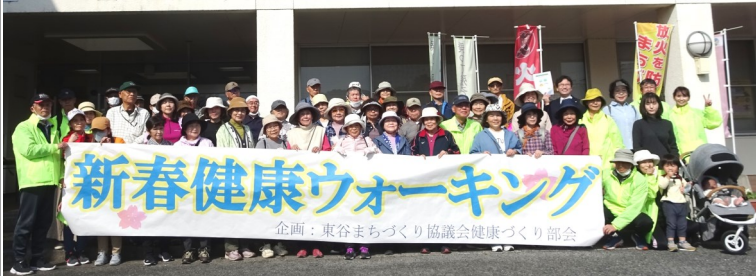
企画：東谷まちづくり協議会健康づくり部会

5月8日（月）は東谷市民センターはワックス清掃の為、クラブ等も使用中止となります。来館者の方も入館できない場合がありますのでご了承ください。