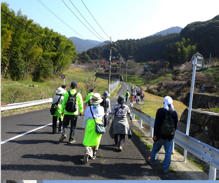
小倉南区役所 東谷出張所

天気も良く絶好の散策日和で0歳から88歳までの58人の参加がありました。市民センターから横山を通り、井手浦の棚田の上まで、土筆や菜の花を観ながら歩きました。浄水場でトイレ休憩をした後は、天疫神社で郷土の歴史について学びました。153年前は、この神社を中心に企救軍の百姓一揆があり、地域を守り抜こうと戦った勇者がいたこと、一同でお参りしました。「普段、車で通る道も歩くことにより新しい発見がある」と参加者の感想を聞きました。これからも歴史ある東谷のことを学びながら、この地域を大事にしていきたいと思いました。